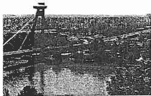
Pozsonyligetfalu panelháza a Duna-híddal