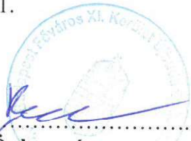
Önkormányzat dr. László Imre polgármester